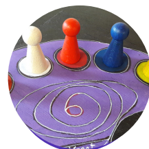
Mystère de la forêt